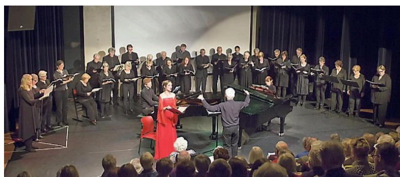
Voci Vivaci brengt requiem van Brahms.